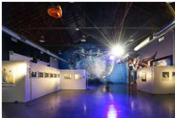
ESPACE COBALT - Mister Freeze 2017