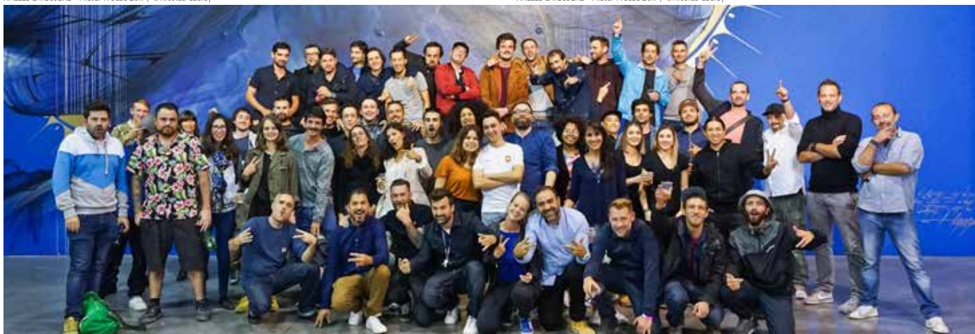
EQUIPE ARTISTIQUE & ORGANISATIONNELLE - Mister Freeze 2017