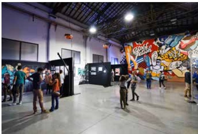
ESPACE COBALT - Mister Freeze 2017

Visuels ci-dessous (et bien d'autres encore) disponibles en HD via le lien suivant en téléchargeant le pack presse : http://expo-misterfreeze.com/