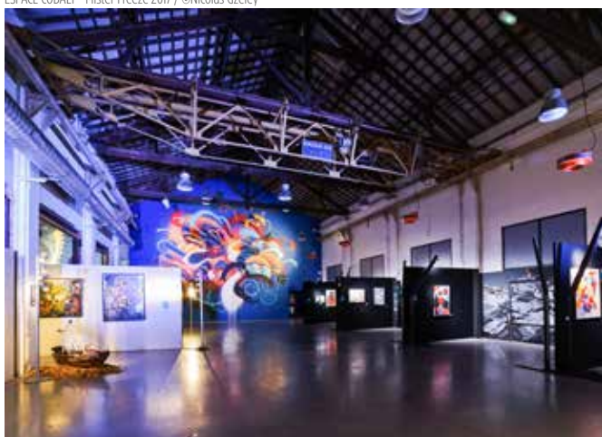
ESPACE COBALT - Mister Freeze 2017 / ©Nicolas Gzeley