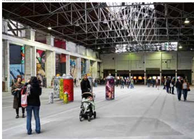
HALLES LATÉCOËRE - Mister Freeze 2017